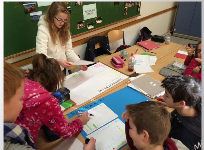
Auswertung einer Umfrage