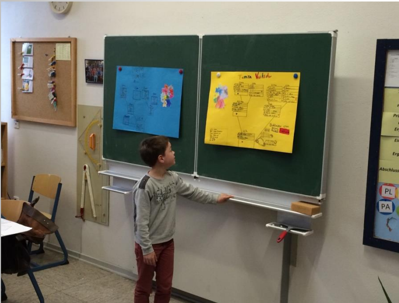
Präsentation der Ergebnisse