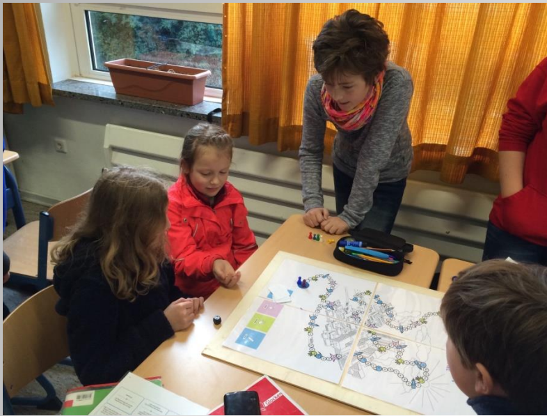
Erstellung eines Beratungsspiels